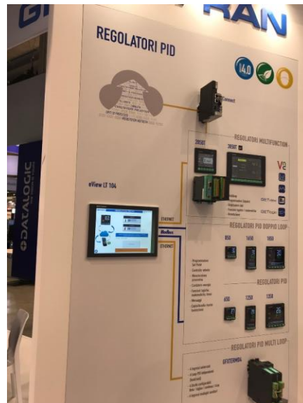
Figura 5 GEFRAN: regolatori PID