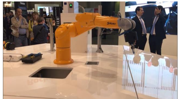
Figura 4 SICK: una parte della smart factory in esposizione