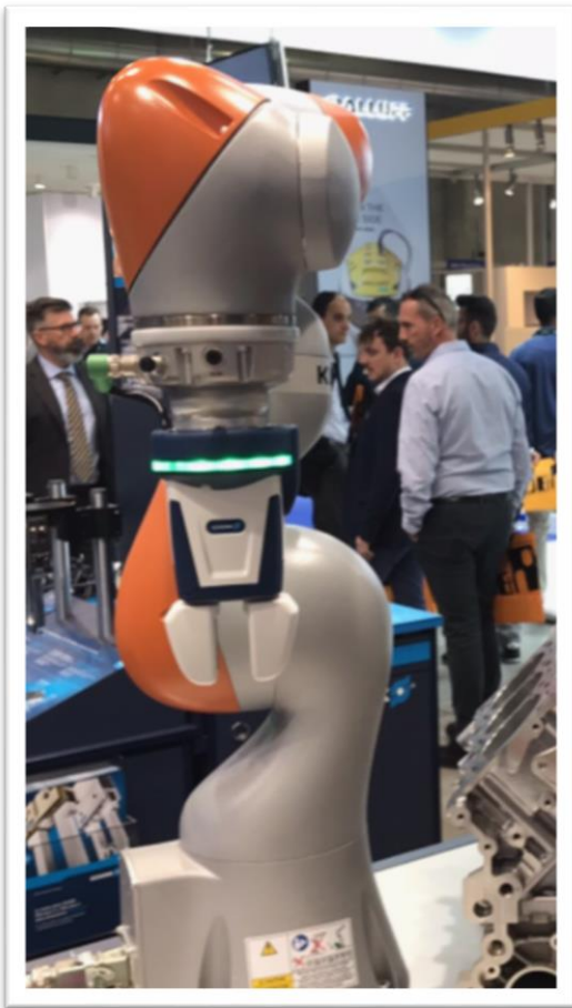
Figura 1 Gripper collaborativo della Schunk

Fondamentalmente ho visto cose molto simili e quindi molta omologazione. Proprio per questo le vere novità stanno nei dettagli e possono essere sia di natura tecnologica ma anche assistenziale, per quanto riguarda l'educazione degli operatori, e legale, in particolare per l'aspetto della sicurezza. I prodotti e i servizi attualmente in vendita sono già il passato e le aziende devono quindi muoversi in avanti cercando di attuare politiche che siano un misto tra conservazione e innovazione. Questo è a mio parere la vera forza delle industrie 4.0 che deve diventare una linea guida non solo per chi produce automazione ma anche per gli utilizzatori finali.